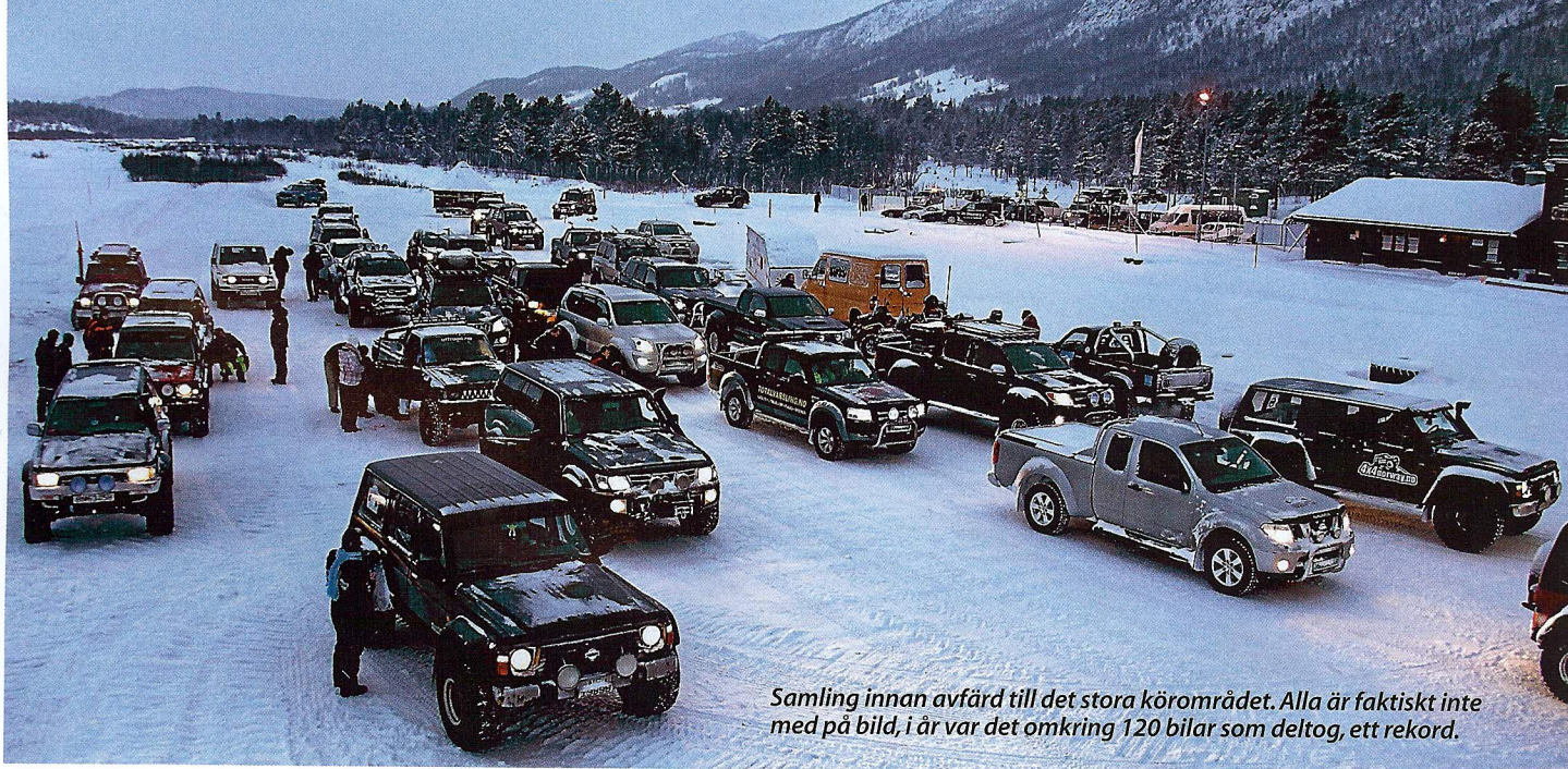
Samling innan avfärd till det stora körområdet. Alla är faktiskt inte med på bild, i år var det omkring 120 bilar som deltog, ett rekord.