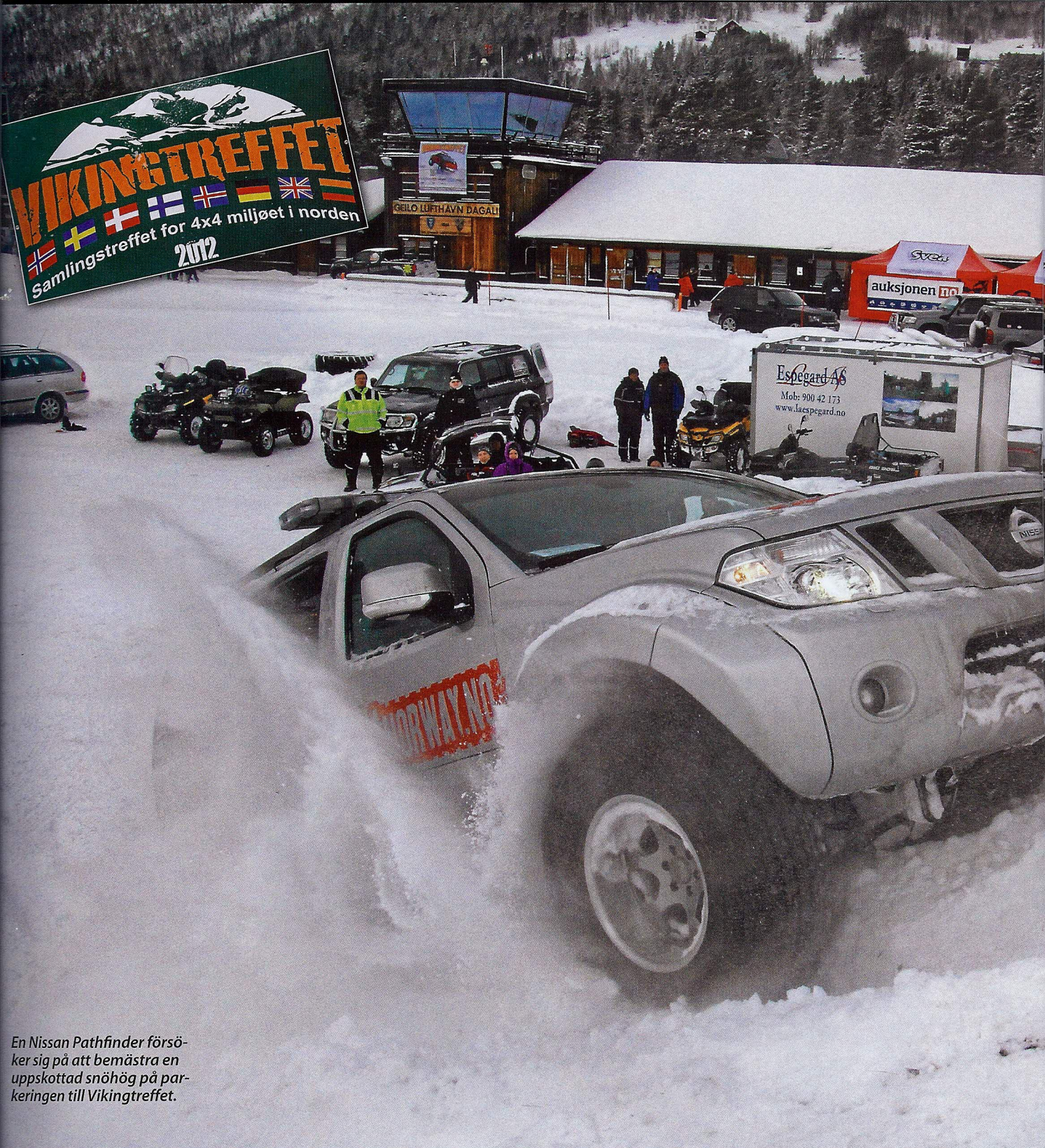
En Nissan Pathfinder försöker sig på att bemästra en uppskottad snöhög på parkeringen till Vikingtreffet.