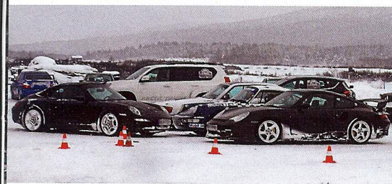
Det stod en salig samling fordon utanför grilltältet. Till och med bakhjulsdrivna Porschar fanns på plats och alla var lika välkomna att köra isbana.