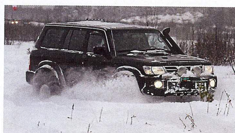
Det låg perfekt med nysnö över hela det stora körområdet. Det fanns alltså gott om möjlighet för off pist med terrängbil.