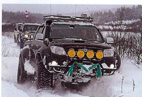
Det här var en av Vikingtreffets tuffare byggen, en radikalt ombyggt Toyota Hilux Arctic Trucks Edition. Mums!