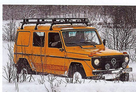
En äldre Mercedes-Benz G Wagen sliter för att komma fram genom snön runt flygplatsen i Dagali.