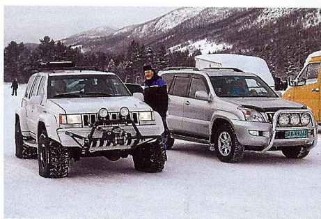
Det var en salig samling fordon på träffen. Här en äldre Jeep Grand Cherokee med urluftade hjul bredvid en "stinnare" Toyota Land Cruiser.